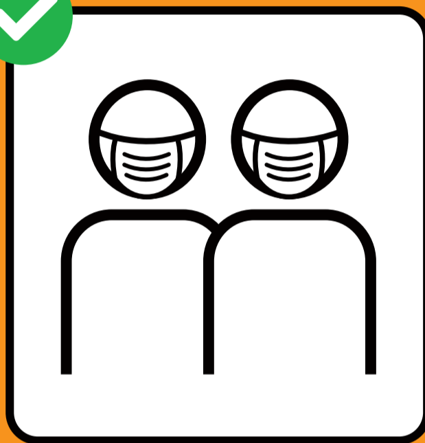
Usare la mascherina se non è possibile tenersi a distanza.