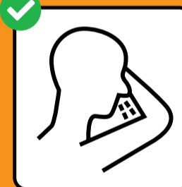
Tossire e starnutire in un fazzoletto o nella piega del gomito.