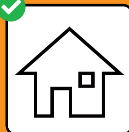
Per chi è positivo al test: isolamento. Per chi ha avuto contatti con una persona positiva al test: quarantena.