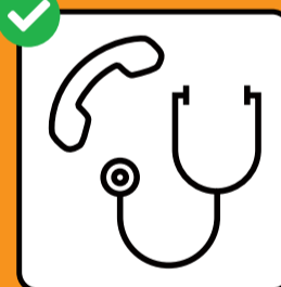
Prima di andare dal medico o al pronto soccorso, annunciarsi sempre per telefono.