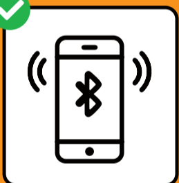
Per interrompere le catene di infezione: scaricare e attivare l'app SwissCovid.