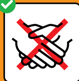
Evitare le strette di mano.