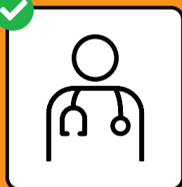
In caso di sintomi, fare immediatamente il test e restare a casa.