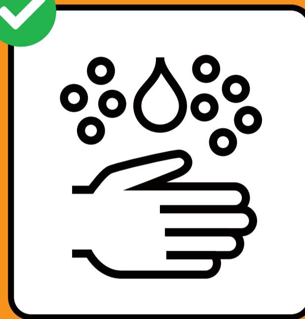
Lavarsi accuratamente le mani.